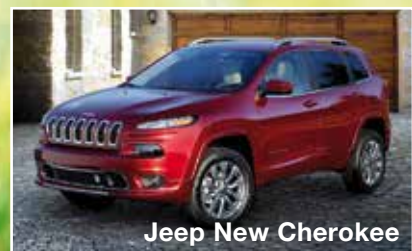
Jeep New Cherokee

Garage Kaufmann AG • Arbonerstrasse 39 • 9300 Wittenbach • T 071 292 15 15 • www.garagekaufmannag.ch