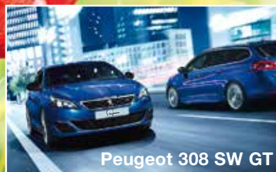
Peugeot 308 SW GT