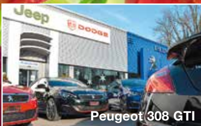
Peugeot 308 GTI

Ausstellungszeiten: Samstag von 9–17 Uhr, Sonntag von 10–16 Uhr