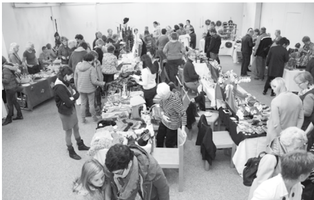
Text und Bild: Der Vorstand

Am Samstag, dem 31. Oktober, ging der 1. Wittenbacher Koffermarkt im Kirchenzentrum St. Konrad über die Bühne. Wir danken allen Ausstellern fürs Kommen mit mitgebrachter guter Laune und vielfältigen Artikeln. Ein ganz herzliches Dankeschön geht auch an unsere Dessertspender, an die Helfer und natürlich an die zahlreichen Besucher. Die Stimmung war super und unser Konrad-Stübli wurde gut besucht. Es musste niemand hungrig und auch nicht durstig nach Hause gehen. Schön, dass so ein Anlass auf die Beine gestellt werden konnte. Ganz herzlichen Dank an alle.