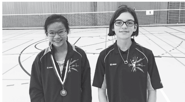
Text und Bilder: Thomas Koch