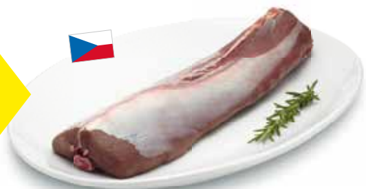
Rehrücken, Tschechien, 100 g, statt 5.95 nur 3.95

SPAR Supermarkt, Zentrum 2, 9300 Wittenbach Mo – Mi, 7.00 – 19.00 Uhr / Do, 7.00 – 20.00 Uhr / Fr, 7.00 – 19.00 Uhr / Sa, 7.00 – 17.00 Uhr. Abgabe nur in Haushaltsmengen. Alle Preise sind in Schweizer Franken angegeben. Satz- und Druckfehler vorbehalten. SPAR verkauft keinen Alkohol an Jugendliche unter 18 Jahren. www.spar.ch