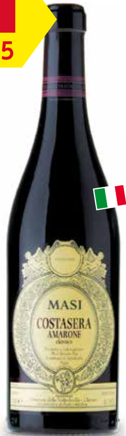
Amarone della Valpolicella Costasera Masi Italien, Veneto, 7,5 dl statt 34.50 nur 27.95