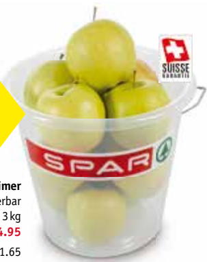
Apfel im SPAR Eimer 3 Sorten zur Auswahl/ selektierbar Eimer à mindestens 3 kg 3 kg statt 7.80 nur 4.95 Preis per kg 1.65