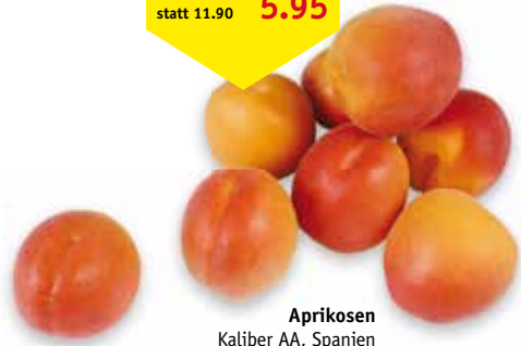
Aprikosen Kaliber AA, Spanien Gitter à 2 kg statt 11.90 nur 5.95

SPAR Supermarkt, Zentrum 2, 9300 Wittenbach Mo - Mi, 7.00 - 19.00 Uhr / Do, 7.00 - 20.00 Uhr / Fr, 7.00 - 19.00 Uhr / Sa, 7.00 - 17.00 Uhr Abgabe nur in Haushaltsmengen. Alle Preise sind in Schweizer Franken angegeben. Satz- und Druckfehler vorbehalten. SPAR verkauft keinen Alkohol an Jugendliche unter 18 Jahren. www.spar.ch