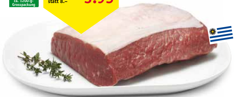
Rindsentrecôte, Uruguay 100g, statt 8.- nur 3.95