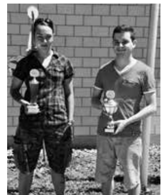
Beste nicht Aktive Dame und Herr