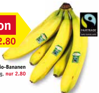
Spar Natur pur Bio-Bananen kg, nur 2.80