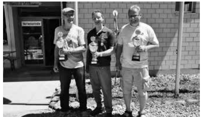
Beste Schützen beim Vereins/Firmenwettkampf