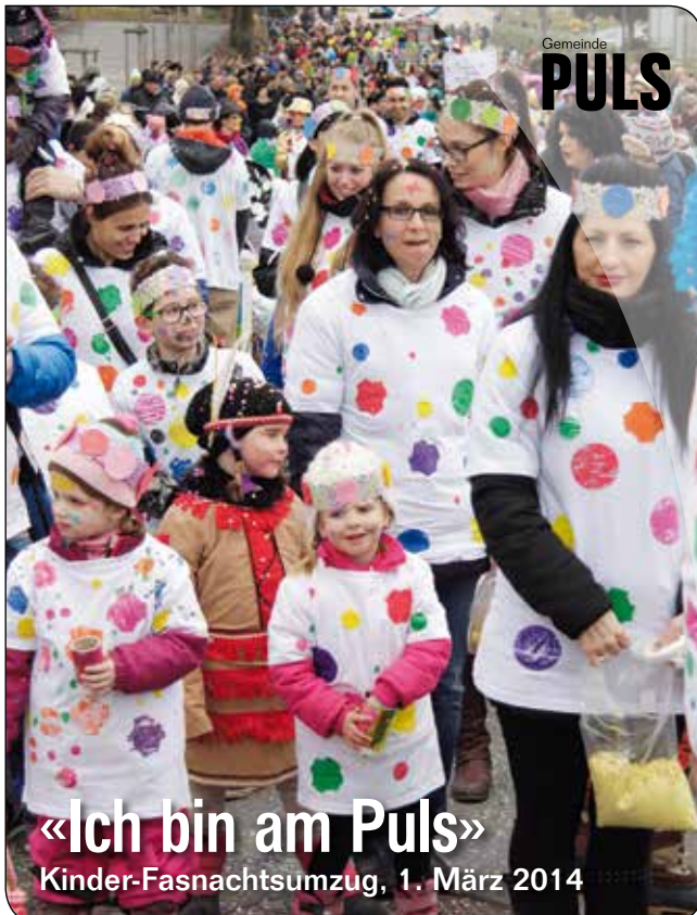
«Ich bin am Puls» Kinder-Fasnachtsumzug, 1. März 2014

St. Gallerstrasse 10 | 9300 Wittenbach | Tel. 071 298 51 11 Mo-Fr 8.00-12.00 Uhr/13.30-18.30 Uhr | Sa 8.00-12.00 Uhr