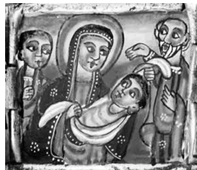
Das Bild ist eine Ikone aus der äthio-pisch-orthodoxen Tradition: «Darstellung Jesu im Tempel».