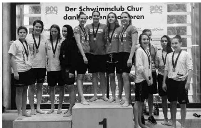
Damenstaffel 4x50m Lagen – Staffel