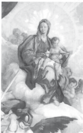
Ausstellung: 3. Oktober bis 15. Dezember 2014 La Salette-Kapelle Untere Waid, Mörschwil