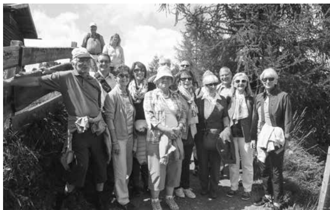
Eine Gruppe beim Abstieg

In Bozen war auch eine Stadtführung auf dem Programm. Die Führerin wusste manch Interessantes aus der Stadtgeschichte und dem Leben der Bewohner zu erzählen. In der Kirche im Zentrum neben dem Waltherplatz erlaubte sich der Chor vierstimmig das «Alta Trinita beata» zu singen, zur Verblüffung der zahlreichen Besucher. Am Abend besuchten wir die hl. Messe in der Klosterkirche; dann das gemeinsame Abendessen im Hotel sowie der Ausklang mit Gesang im Hotel.