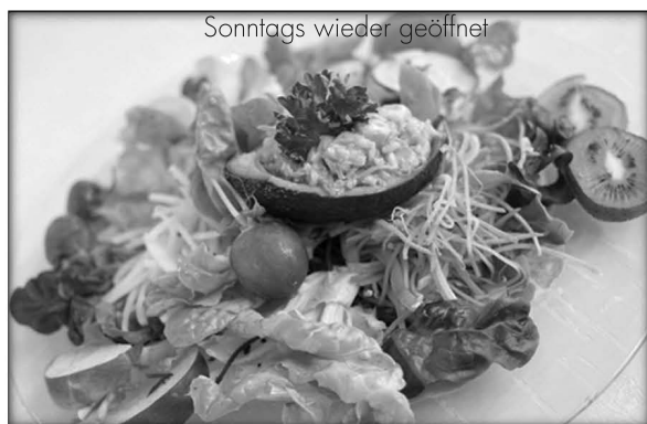
Sonntags wieder geöffnet

Mo-Fr 7.30 - 19.00 Uhr Sa 7.30 - 18.00 Uhr So 8.00 - 18.00 Uhr